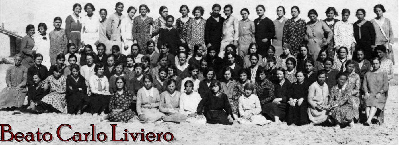
Un gruppo di giovani cresciute e vissute accanto alla carità e all'amore del beato Carlo Liviero